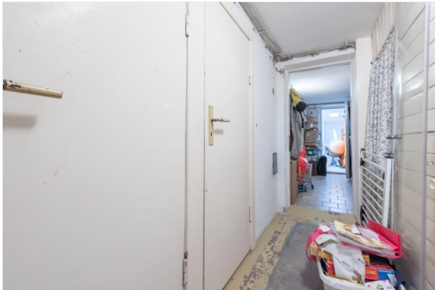
Keller Ansicht 3