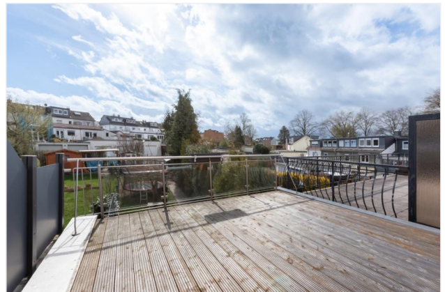
Terrasse 1.OG Ansicht 1