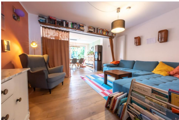
Wohnbereich Ansicht 6