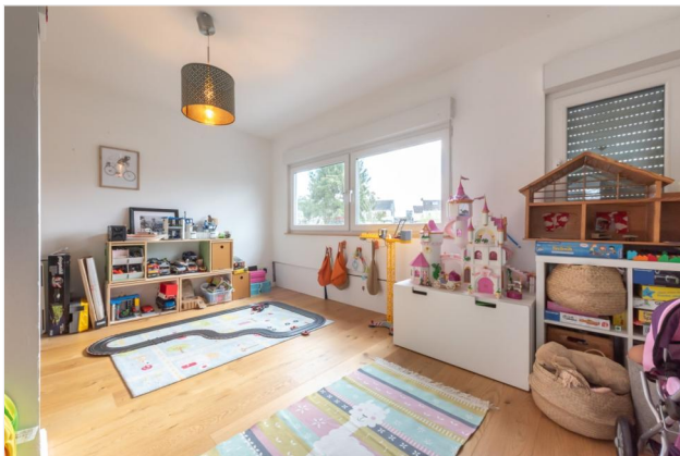
Kinderzimmer DG Ansicht 2