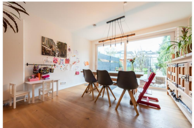
Wohnbereich Ansicht 1