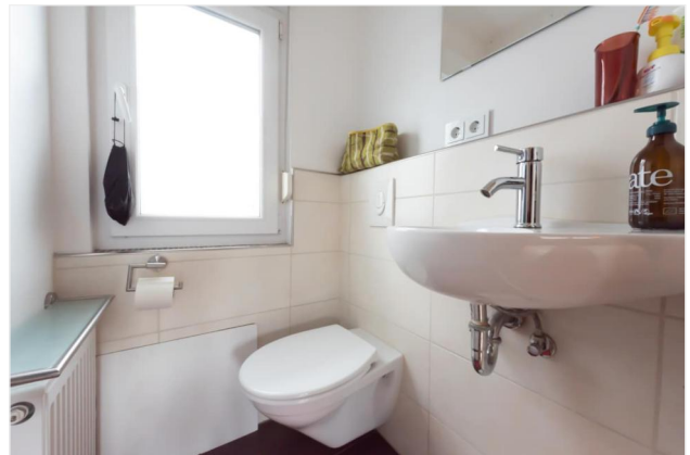
WC im DG