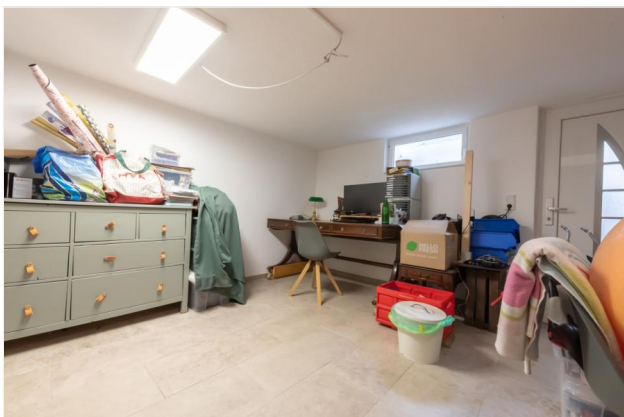
Keller Ansicht 1