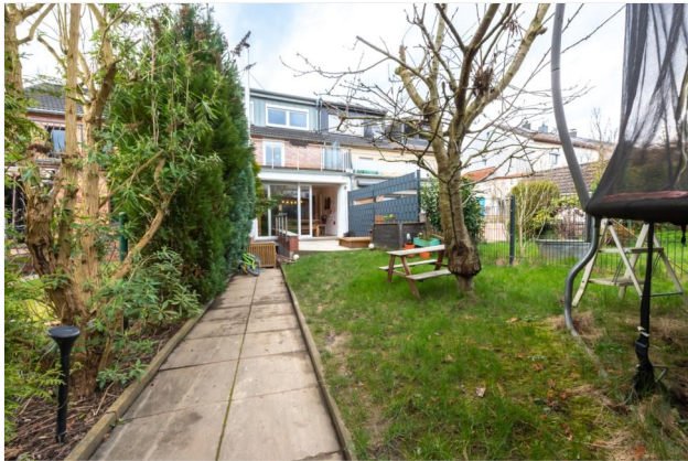
Garten Ansicht 2