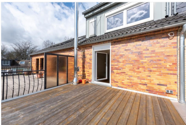
Terrasse 1.OG Ansicht 2