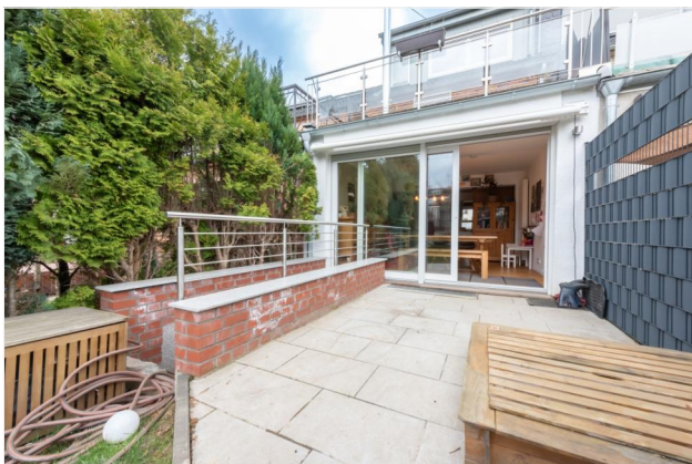
Terrasse Ansicht 2