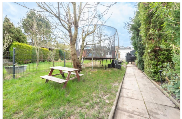
Garten Ansicht 1