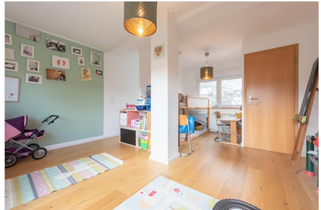
Kinderzimmer DG Ansicht 1