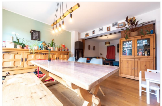
Wohnbereich Ansicht 3