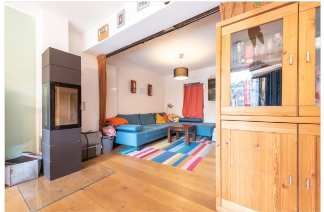
Wohnbereich Ansicht 5