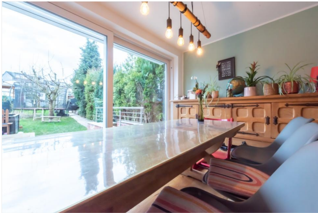
Wohnbereich Ansicht 4