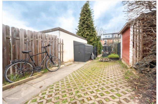
Garten Ansicht 3