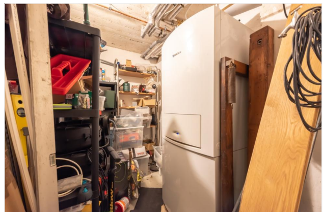
Keller Ansicht 2