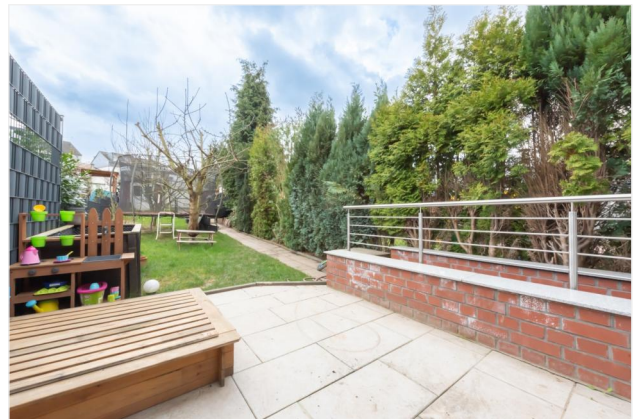
Terrasse Ansicht 1