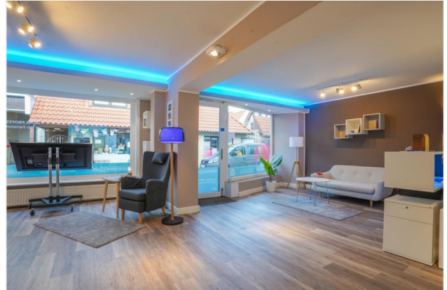
Arbeiten, wo andere Urlaub machen